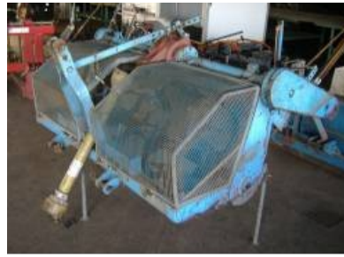
Foto: Oude beveiligde spitmachine