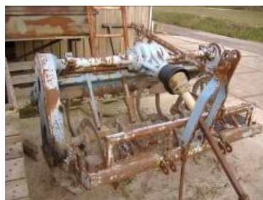
Foto: Oude onbeveiligde spitmachine