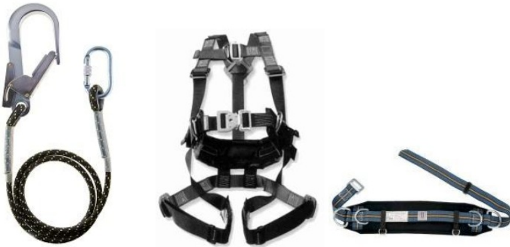
Afbeelding: positioneringslijn, full body harnas en broekgordel.