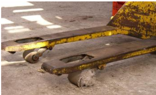
draad tussen de wielen