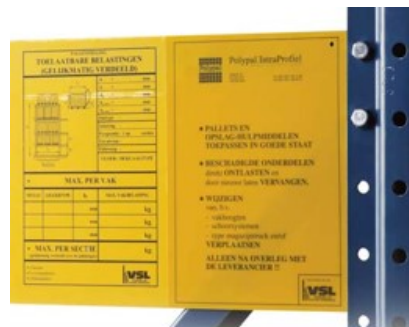
Afbeelding: Belastingsplaat magazijnstellingen