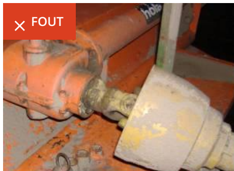
Kap werktuigzijde ontbreekt