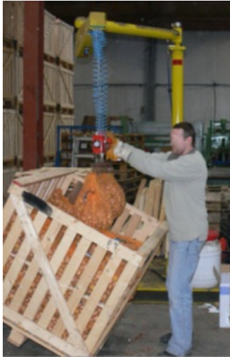
Afb.: Werken met liftstelsysteem