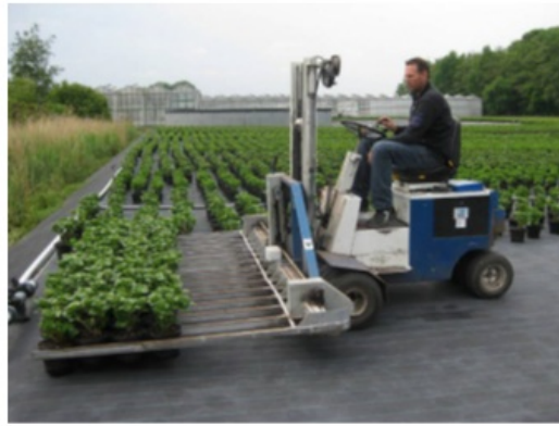
Afb.: Werken met heftruck