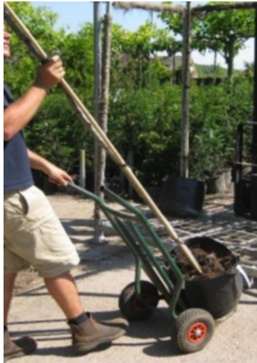
Afb.: Kar met verstelbare beugel voor tillen en verplaatsen van potten