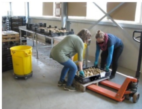
Afb.: Met z'n tweeën tillen