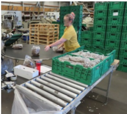
Afb.: Draaischijf als buffer na afvoerband en rollerbanen