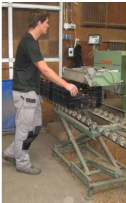
Afb.: Schaartafel (traploos in hoogte verstelbaar)