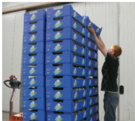
Afb.: Op- afstapelen boven schouderhoogte is ongunstig voor rug en schouders