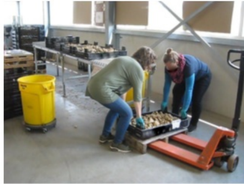
Afb.: Met z'n tweeën tillen