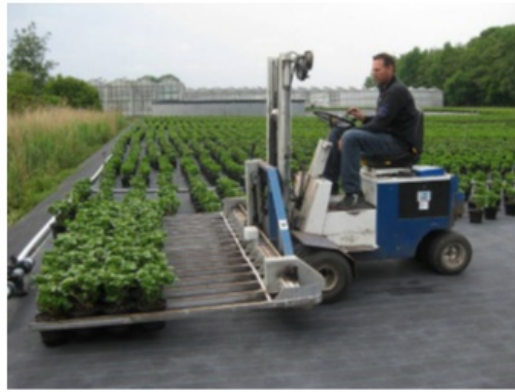
Afb.: Werken met heftruck