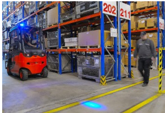
Afbeelding: "Blue spot"