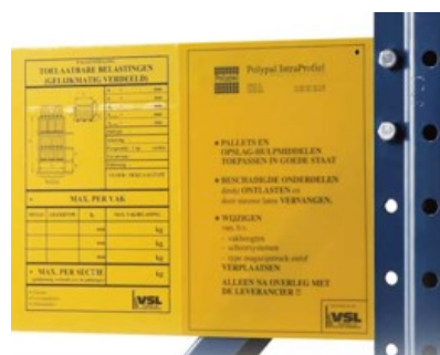
Afbeelding: Belastingsplaat magazijnstellingen