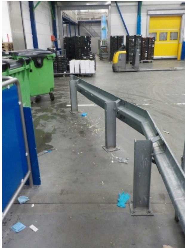
Afbeelding: voorbeeld hekwerk