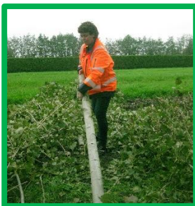
GOED: eerst één zijde tillen