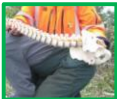
GOED: rug recht