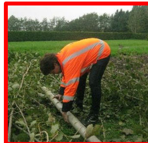
FOUT: in één keer gebukt tillen